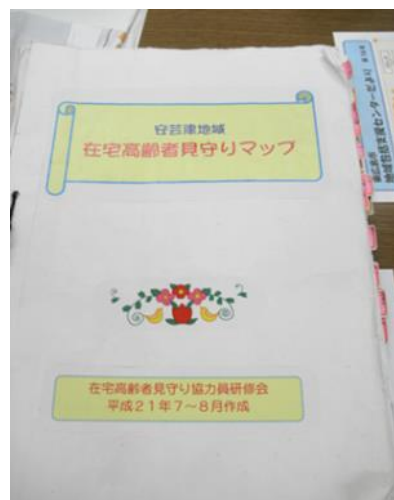
＜「在宅高齢者見守りマップ」の表紙＞